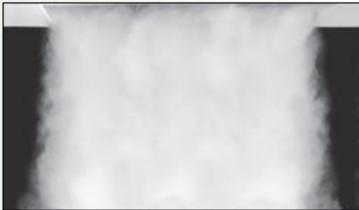
Photo 2: All data is confirmed through rigorous testing in our research and development center.

• Velocity vs. distance is shown based on CFM/square foot of active face area, and is not dependent upon the size of the face.